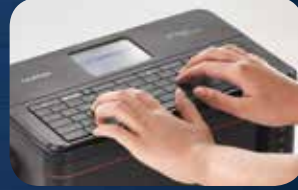
صمم رسم الطباعة على الأنبوب أو الملصق. أو للسهولة، استخدم لوحة المفاتيح لاختيار قالب