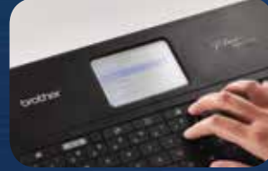
حدد خيارات الطباعة عن طريق لوحة مفاتيح الطباعة