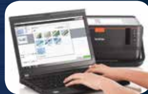
استخدم البرنامج Brother Cable Label Tool أو Brother P-touch Editor لتصميم القوالب