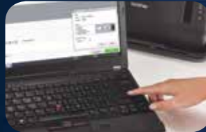
أرسل الملف للطباعة