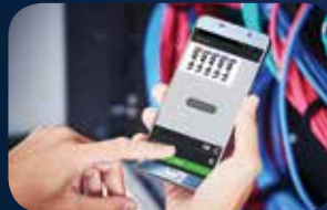
أرسل الملف للطباعة