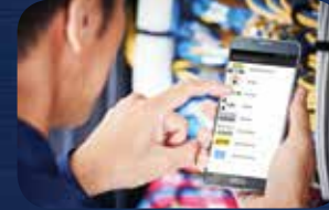
حدد خيارات الطباعة على الجهاز المتحرك