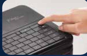
اضغط زر الطباعة