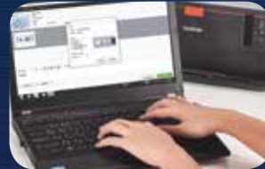
حدد خيارات الطباعة على الكمبيوتر