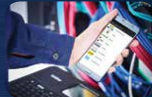
صمم رسم الملصق على الجهاز المتحرك باستخدام التطبيق Mobile Cable Tool أو Brother iPrint & Label

قابلة للحمل بشكل مثالي يمكنك تشغيل الطباعة في أي مكان ووقت باستخدام بطارية Li-ion القابلة للشحن وإمكانية الاتصال اللاسلكي.